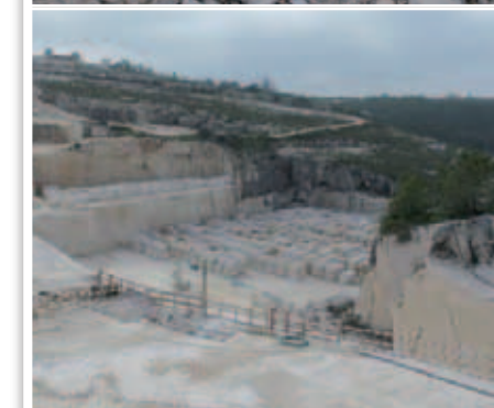
Steinbruch 1: Blick in den Chorraum von St. Moritz während der Baumaßnahmen. Steinbruch 2: Für weißen Kalkstein aus Portugal haben sich Architekten und Kirchenstiftung von St. Moritz entschieden.