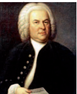
Johann Seb. Bach