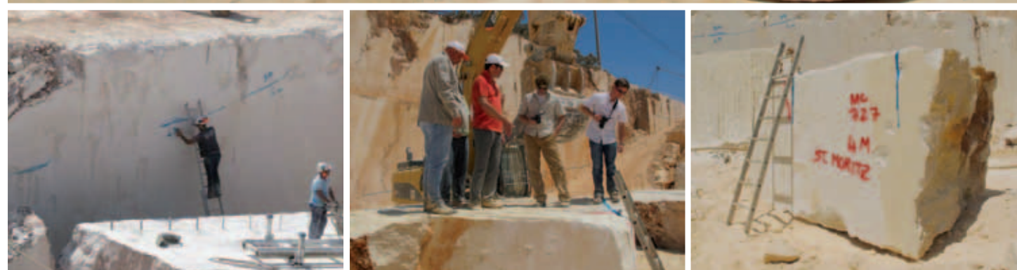
Bagger 1: schweres Gerät mitten im Hauptschiff von St. Moritz. • Bagger 2: Steinbruch in der Nähe der portugiesischen Hauptstadt Lissabon, wo eine Abordnung von St. Moritz die seltene Gelegenheit hatte, die Steinblöcke für Altar, Ausstattung und Fußboden der neugestalteten Kirche selbst auszuwählen.