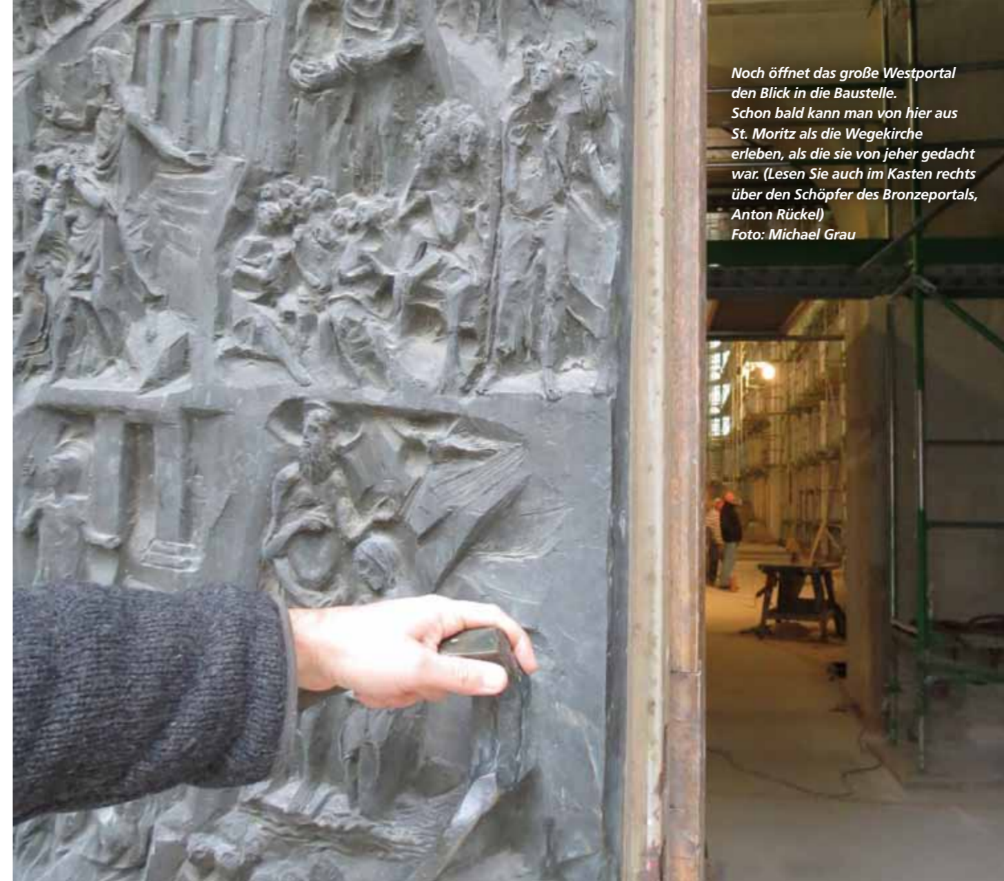
Noch öffnet das große Westportal den Blick in die Baustelle. Schon bald kann man von hier aus St. Moritz als die Wegekirche erleben, als die sie von jeher gedacht war. (Lesen Sie auch im Kasten rechts über den Schöpfer des Bronzeportals, Anton Rückel)

Wenn ich zu einer Kirche komme, erwarte ich eigentlich, dass sie offen ist, d.h. dass ich durch die Tür selbstständig eintreten darf. Hier habe ich noch das Gefühl eines Ortes, wo ich ganz ungeniert die Tür öffnen kann, weil ich weiß, dass ich dort innen bekannt und irgendwie immer willkommen bin. Wo immer ich mich auf der Welt befinde, das Betreten des Kirchenraumes ist in gewisser Weise immer ein Heimkommen. Freilich ist gerade das Kirchenportal ein Übergang der ganz besonderen Art. Es kennzeichnet eine Grenze von Weltlichem und Heiligem