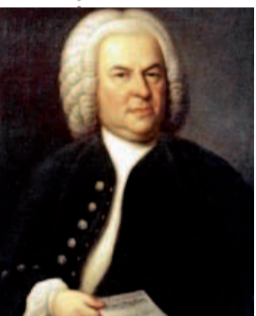
Johann Seb. Bach