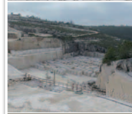
Steinbruch 1: Blick in den Chorraum von St. Moritz während der Baumaßnahmen. Steinbruch 2: Für weißen Kalkstein aus Portugal haben sich Architekten und Kirchenstiftung von St. Moritz entschieden.