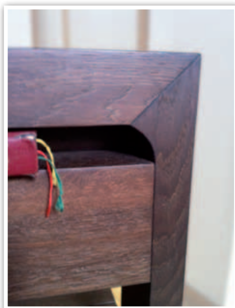
Auf die Ausstattung seiner Räume legt unser Architekt John Pawson besonderen Wert. Das neue Kirchengestühl von St. Moritz soll klar und zweckmäßig sein und trotzdem zu Ruhe und Sammlung einladen.

wählen sollten. Ich gebe zu, dass ich aufgrund meiner Erfahrungen in Frankreich zunächst sehr stark die Stühle favorisierte. Die Möglichkeit, damit in Zukunft sehr flexible Raumgestaltungen vornehmen zu können, faszinierte mich. Nach ersten Gesprächen mit unseren Architekten vom Büro Pawson wurde mir aber schnell klar, dass dort die Bänke bevorzugt wurden. Pawson will mit seinem Ansatz der Reduktion auf das Wesentliche im Raum vor allem Klarheit und Ruhe erzeugen. Die Stühle aber würden diesen Eindruck eher trüben denn