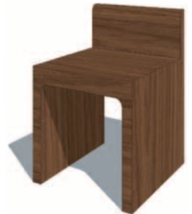
Idee und Gestaltung: Michael Grau mit freundlicher Genehmigung durch JPA (Jan Hobel)

moritzkirche Sakrale Objekte Nr.7 zur Neugestaltung 2012